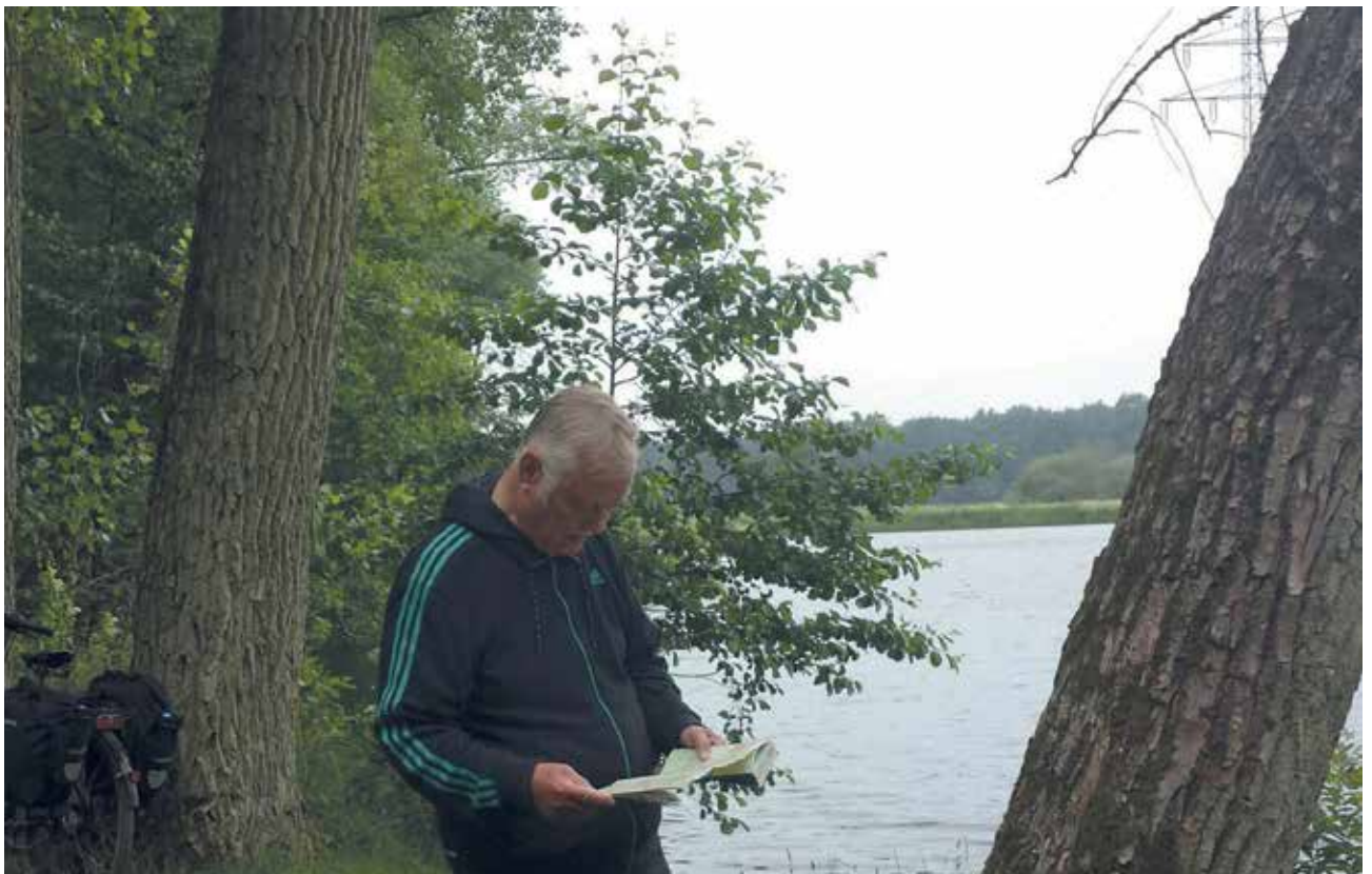
Jede Trink- oder Pinkelpause wurde zur Orientierung genutzt.

Unseren ursprünglichen Plan, über Gifhorn in Richtung Wolfsburg nach Magdeburg zu radeln, kippten wir schnell. Wir hatten einerseits den nach Norden fließenden Elbe-