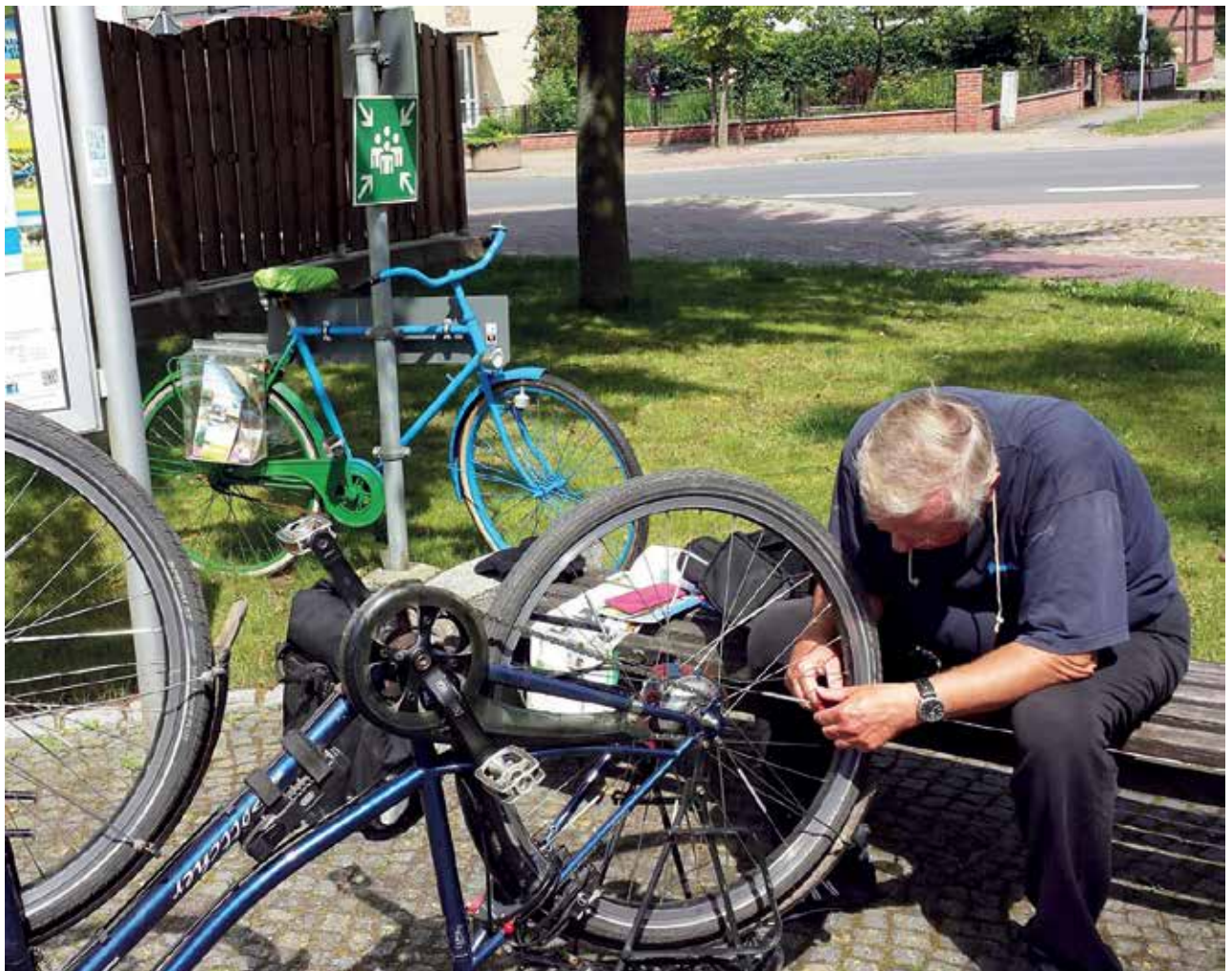
Die verschiedenen Straßenbeläge wie Schotter, Waldwege und Kopfsteinpflaster waren eine starke Belastung für die Speichen. Aber Zentrieren ist kein Hexenwerk, mit gutem Werkzeug ein Klacks.

Im Touristenbüro Verden war man sehr freundlich zu uns Radlern und nannte uns 4 Hotels im Umkreis von 2 Kilometern, bei denen Radler willkommen wären. Man gab