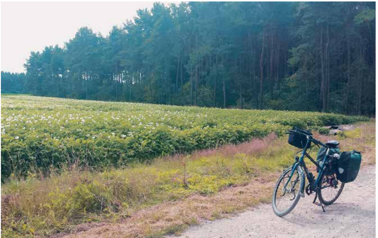
Niedersachsen ist das größte Kartoffel-Anbaugebiet Deutschlands. Wir sahen große Schläge wie hier, die weiß oder lila blühten.