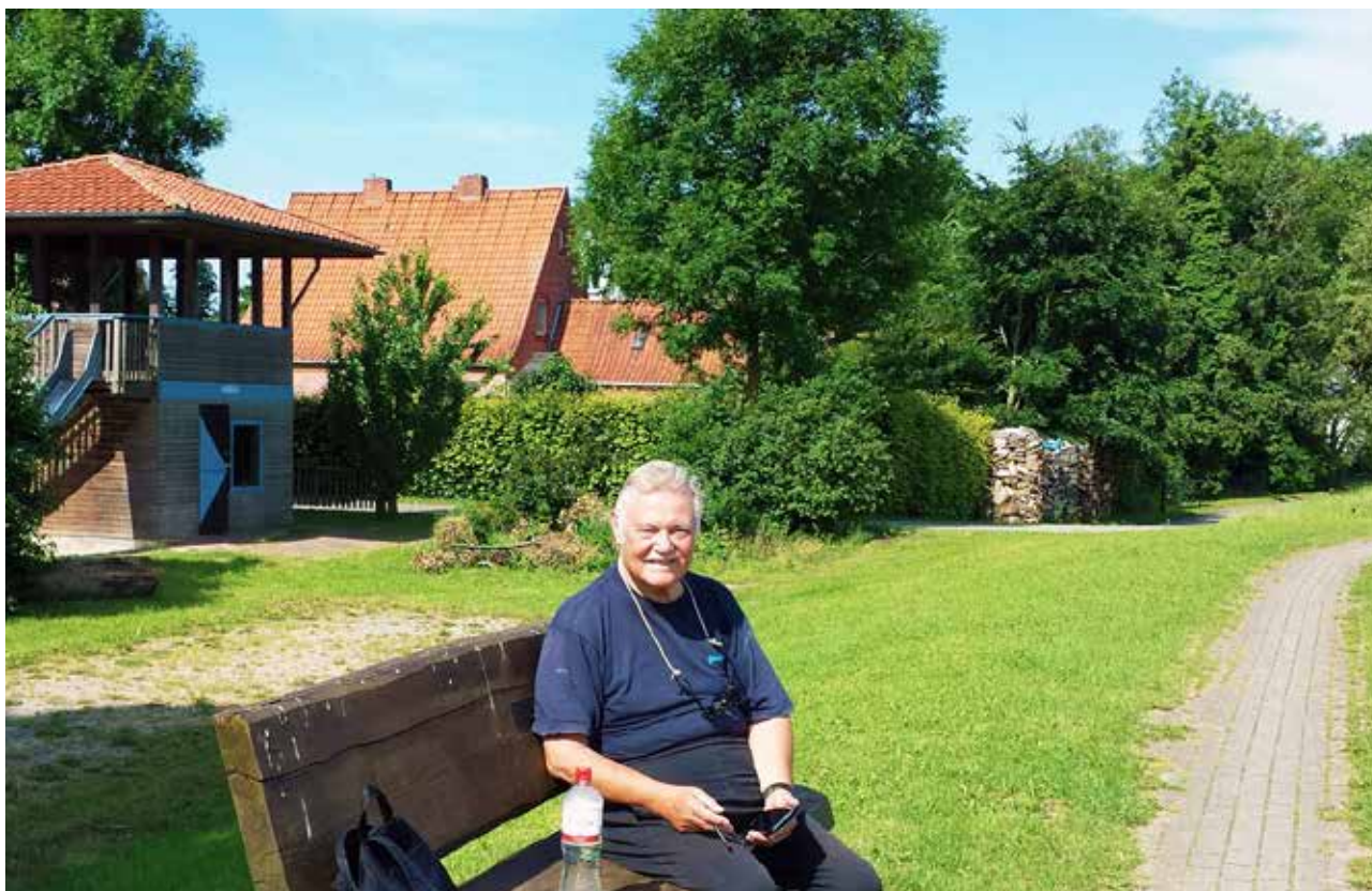
An der Strecke gab es beschauliche Rastplätze für kurze Erholungspausen. Ganz wichtig: Wir hatten immer mehrere Flaschen Mineralwasser an Bord.

Nach früheren Reisen hatten wir festgestellt, daß wir jedes Mal viel zuviel Klamotten mit an Bord hatten. Dicke Pullover und Regenjacken für kalte Tage zum Beispiel, aber auch reichlich Lektüre, für die man abends weder Lust noch Zeit hatte. Durch einige Pannen, die wir unterwegs schon mal erlebt hatten, packte ich jedes Mal auch zu viel Werkzeug mit ein. Dieses Mal sollte alles anders werden. Wir wollten Gewicht sparen. Allein schon aus dem Grund, wenn man z.B. beim Umsteigen auf verkommenen Bahnhöfen ankommt, bei denen die Fahrstühle defekt sind und