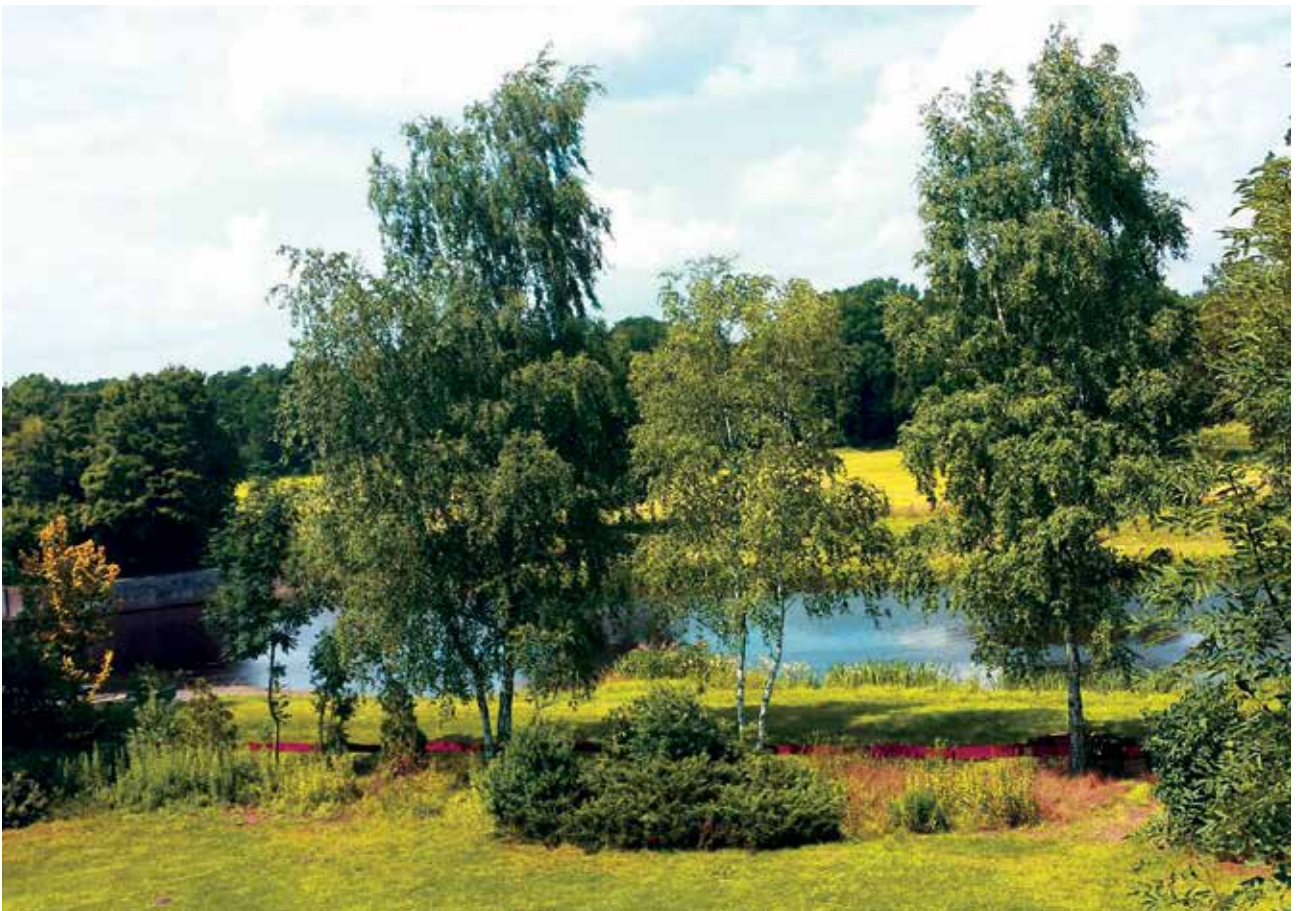
Dieser schöne Blick aus dem Hotelfenster des Landgasthofes „Allerparadies“ bei Langlingen regte uns an, in die Aller zu springen, die hier eine leicht bräunliche Farbe hatte, gesundes Moorwasser.

Anschließend ließen wir uns von der Sonne trocknen und genossen das Treiben am Fluß. Als eine Gruppe Kanuten