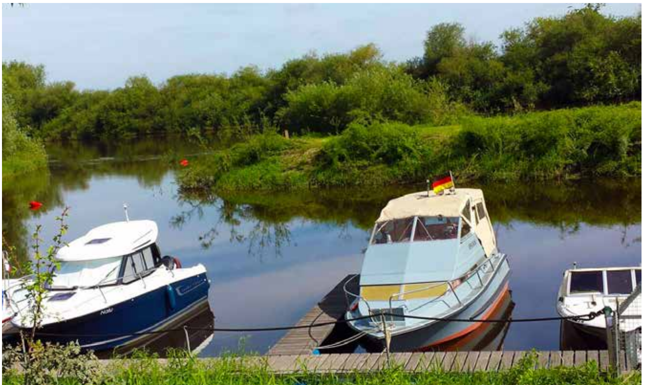
Die Aller ist für die Berufsschiffahrt bis Winsen, für die Sportschiffahrt bis Celle schiffbar.