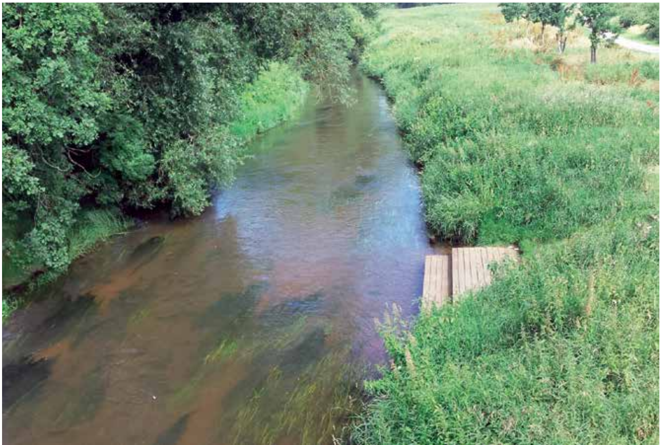
Die Wasserqualität der Aller war erstaunlich gut. Wir konnten sogar Forellen beobachten, ein Indikator für sauberes Wasser.

Als Tagesziel hatten wir uns Hodenhagen ausgeguckt, bekannt durch den Serengeti-Wildpark. Ich wußte von früheren Besuchen ( der Serengeti-Park war einmal ein mehr oder weniger gut zahlender Kunde der IDEA-Werbeagentur gewesen, bei der ich u.a. für die Serengeti-Drucksachen-Produktion verantwortlich gewesen war ), daß es dort ein Hotel der Best-Western-Kette gab, die weltweit durchweg ein einheitliches Niveau haben, mit Pool und Sauna. Ich hatte aber nicht mitbekommen, daß dieses Hotel inzwischen längst verkauft worden war. Es heißt nun „Michel & Friends“. Nach schönen Waldwegen und zauberhaften