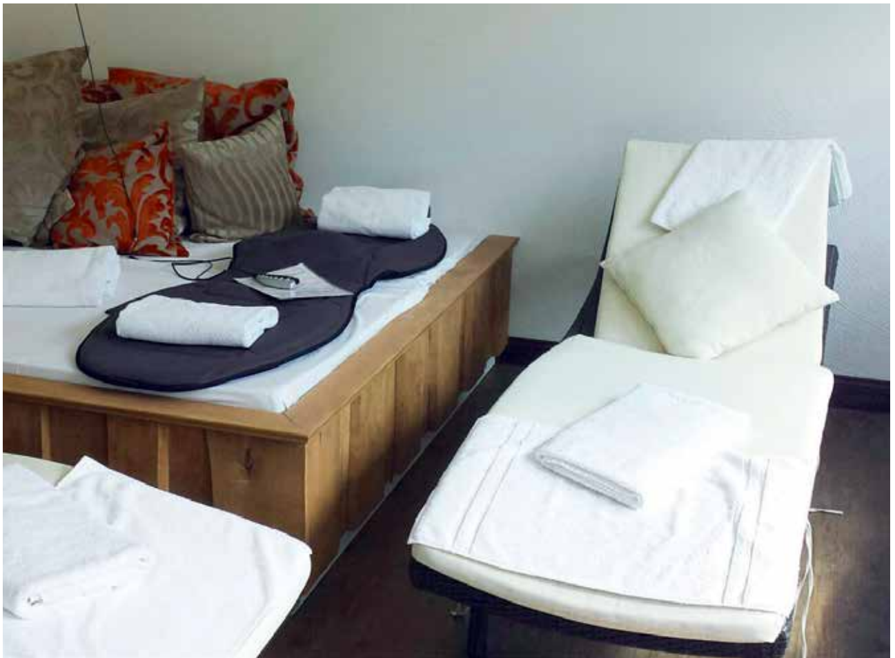
Im Landhotel „Jann Hinsch“ in Winsen/Aller fanden wir eine wunderschöne Sauna-Landschaft vor. Besonders wirkungsvoll war die elektrische Massagematte zur Selbstbedienung.

Am Schulmuseum in Bothmer sind wir ohne Besichtigung vorbeigefahren, ebenso wie am Schloß. Das Erdölmuseum in Wietze kannten wir auch schon von einer früheren Radtour, dieses Mal hatten wir partout kein Interesse daran, alte Bohrtürme zu besichtigen. Unterwegs trafen wir immer wieder auf Einzel-Radler und Gruppen, die mit e-bikes unterwegs waren und auf Anfrage nur Positives zu berichten wußten. Besonders Senioren betonten immer wieder, daß man sowas schon viel früher hätte kaufen sollen. In den Rad-Führern und vor allem im Internet war mehrfach das „Landhotel Jann Hinsch“ in Winsen positiv erwähnt worden. Hier erlebten wir das genaue Gegenteil von Hodenhagen. Gastlichkeit pur. Freundliches Personal, welches auch untereinander einen netten und kollegialen Ton pflegte. Eine perfekte Sauna mit einer elektrischen Massage-Liege und verschiedenen Kies-Beeten für die Fuß-Durchblutung. Beim Abendessen ließ ich mich leider zu einem 360-Gramm-Angus-Burger verführen. Ein großer Fehler, denn er lag mir nachts wie Blei im Magen. Dieses