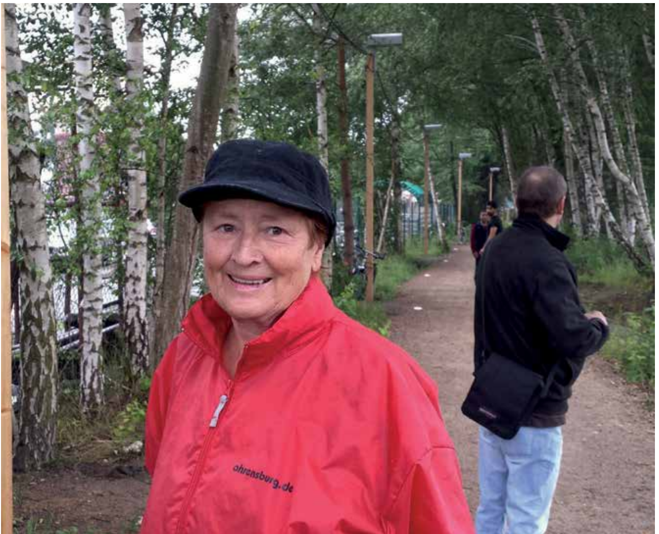
Der Bahnhof Wittingen war eine einzige Baustelle. Als sich der Fahrkartenautomat als defekt erwies, erwogen wir zunächst, trotz des Regens nach Uelzen zu radeln.

Angekommen vor Ort stellten wir fest, daß das betreffende Hotel-Restaurant geschlossen war und das Hotel an einer wichtigen Kreuzung lag, wo man die lauten Lastwagen-Diesel beim Warten und Anfahren hörte. Als wir uns nach dem Duschen auf den Weg zu unserem Abendessen aufmachten, entdeckten wir die wahre Nummer 1 unter Wittingens Hotels, das „Wittinger Tor“. Am Rand der Altstadt gelegen, ruhige Lage, der Biergarten unter einer riesi-