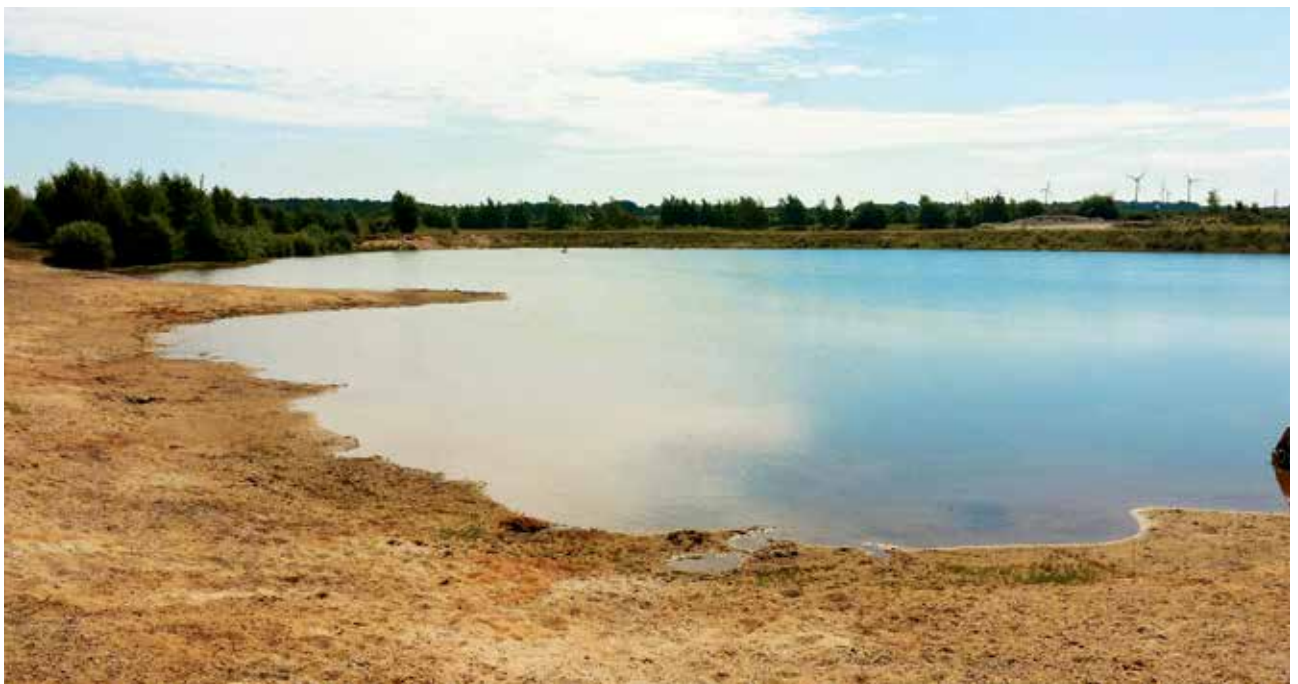
In der Nähe des Ortes Buchholz führte der Aller-Radweg direkt an einer Kiesgrube vorbei, die als Badestelle ausgewiesen war. Das nutzten wir natürlich aus und gönnten uns ein Erfrischungsbad.

Beim Abendessen waren die Kellner trotz des lauen Sommerabends nicht bereit, draußen im Biergarten zu servie-